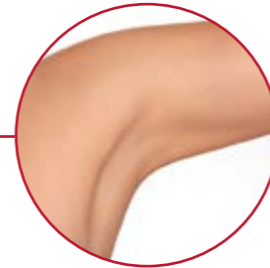
SCHWEISSDRÜSENABSAUGUNG MIRADRY® | S. 34