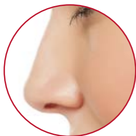
NASENOPERATION | S. 16