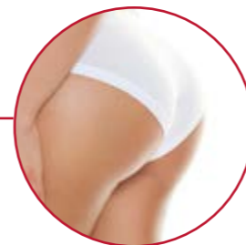
PO-STRAFFUNG | S. 31