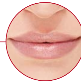
LIPPEN | S. 17

„Das Gesicht überstrahlt alles. Im Zusammenspiel mit unserer Haarpracht kann es in Sekunden darüber bestimmen, ob wir sympathisch wirken oder nicht. Optimierungen an Kopf und Gesichtsensemble stimmt S-thetic ganz auf Ihre Persönlichkeit ab. Wir lassen dabei höchste Sorgfalt walten.“