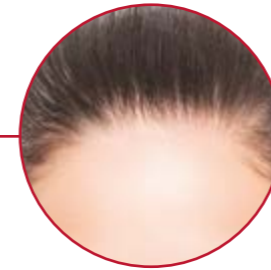
HAARWUNSCHBEHANDLUNG EIGENHAARTRANSPLANTATION | S. 38-41