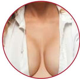
BRUSTVERGRÖßERUNG · IMPLANTATWECHSEL | S. 20–22, 31

Auch die Bereiche unterhalb von Hals und Kinn können wir bei S-thetic gezielt verschönern.