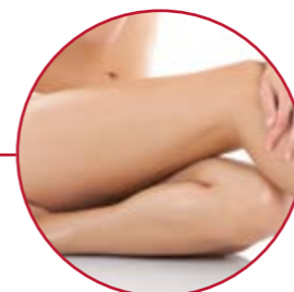
OPERATIVE HAUSTRAFFUNG | S. 33