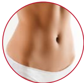
KÖRPERFORMUNG · LIPÖDEMTHERAPIE | S. 24–33