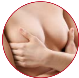
BRUSTVERKLEINERUNG · BRUSTSTRAFFUNG BRUSTWARZENKORREKTUR | S. 22–23