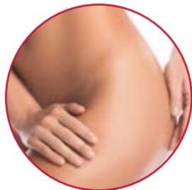
SCHAMLIPPENKORREKTUR · VENUSHÜGELVERKLEINERUNG | S. 35