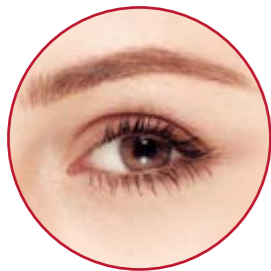
AUGENLIDKORREKTUR | S. 16