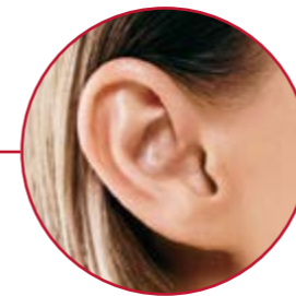
OHREN | S. 17