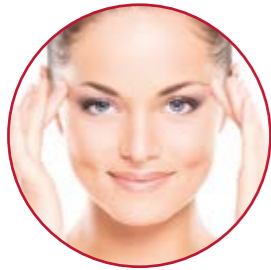
GESICHTSLIFTING · HAUTVERJÜNGUNG | S. 12-15

Hier zeigen wir Ihnen auf einen Blick, welche Verschönerungsmöglichkeiten S-thetic Ihnen rund um Kopf und Gesicht bietet.